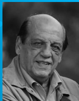
JUAN JOSÉ MUSSI INTENDENTE MUNICIPAL @jjosemussi