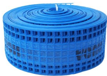
Imagen 1: Malla de advertencia para agua

Cinta de Detección y Advertencia: Esta cinta, se instalara a 30 cm por sobre cañerías y tendrá las siguientes características: color azul; ancho 150mm aproximadamente; deberá tener impresa la siguiente leyenda “CUIDADO, CAÑERIA DE AGUA” a lo largo de toda su longitud con letras de 30 mm de altura como mínimo; será de material plástico, el que podrá presentar orificios; inserto en la cinta deberá tener un alma de aluminio o sistema equivalente a efectos de permitir la detección desde la superficie mediante equipamiento idóneo. A continuación, se muestra de manera ilustrativa la misma.